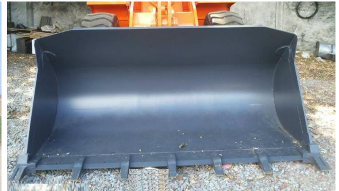
Ковши на погрузчиках конкурентов